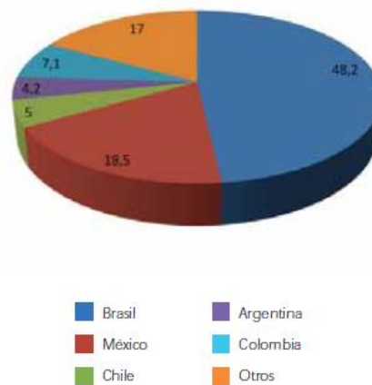
Gráfica 1. Distribución porcentual de programas de posgrado en América Latina.

El aumento en la formación posgradual en América Latina ha favorecido la mejora global de la enseñanza enfermera, dado básicamente por el incremento en el número de doctores y magísteres en las universidades, donde el 60% tiene uno de estos títulos o están en camino de obtenerlo. Otro punto a favor es la creación de grupos de investigación y el aumento en el número de publicaciones científicas de impacto (18). En la siguiente grafica se muestra la distribución porcentual de los programas de posgrado a nivel de Latinoamérica: